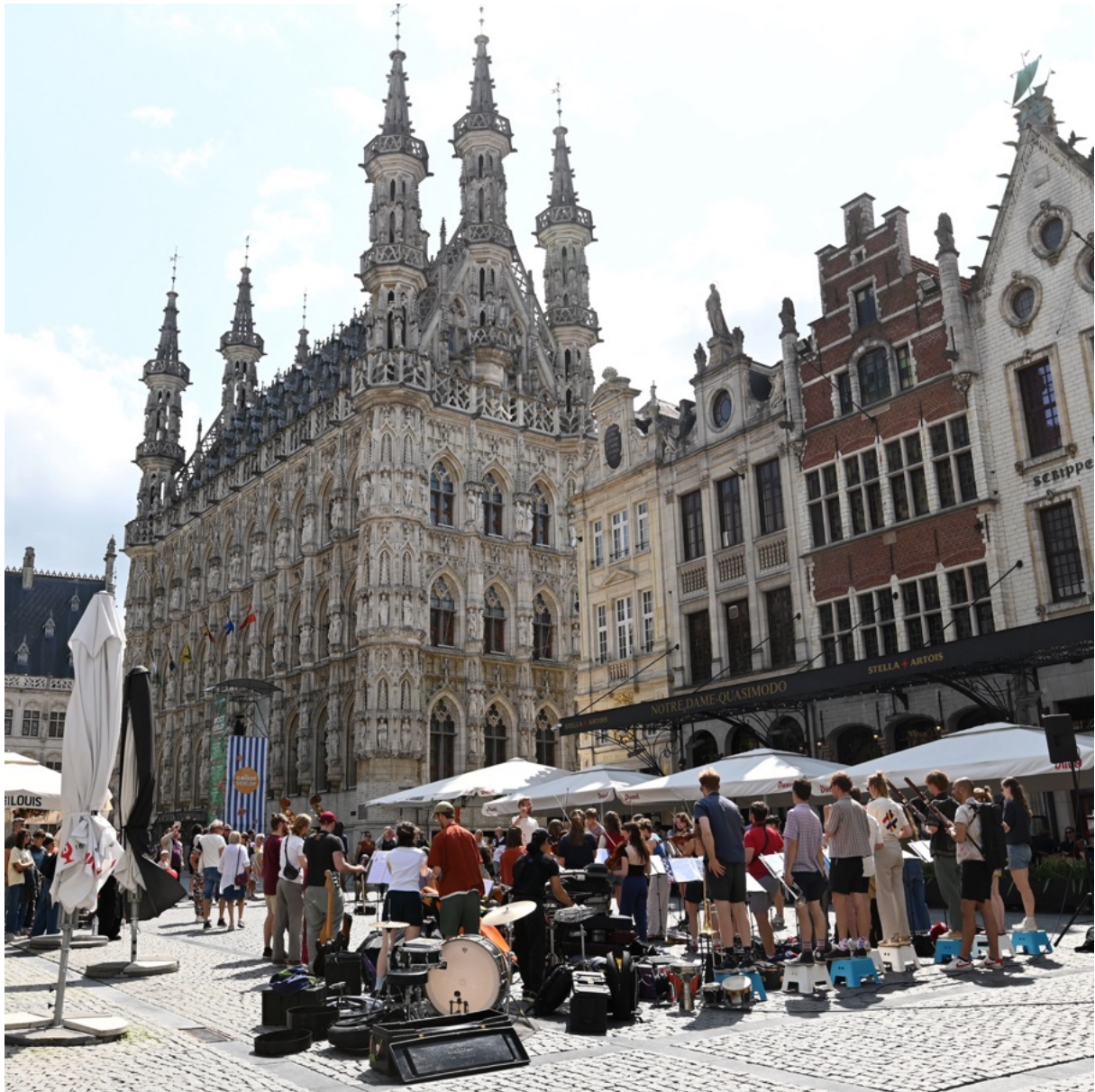
WildOp! op de Grote Markt in Leuven