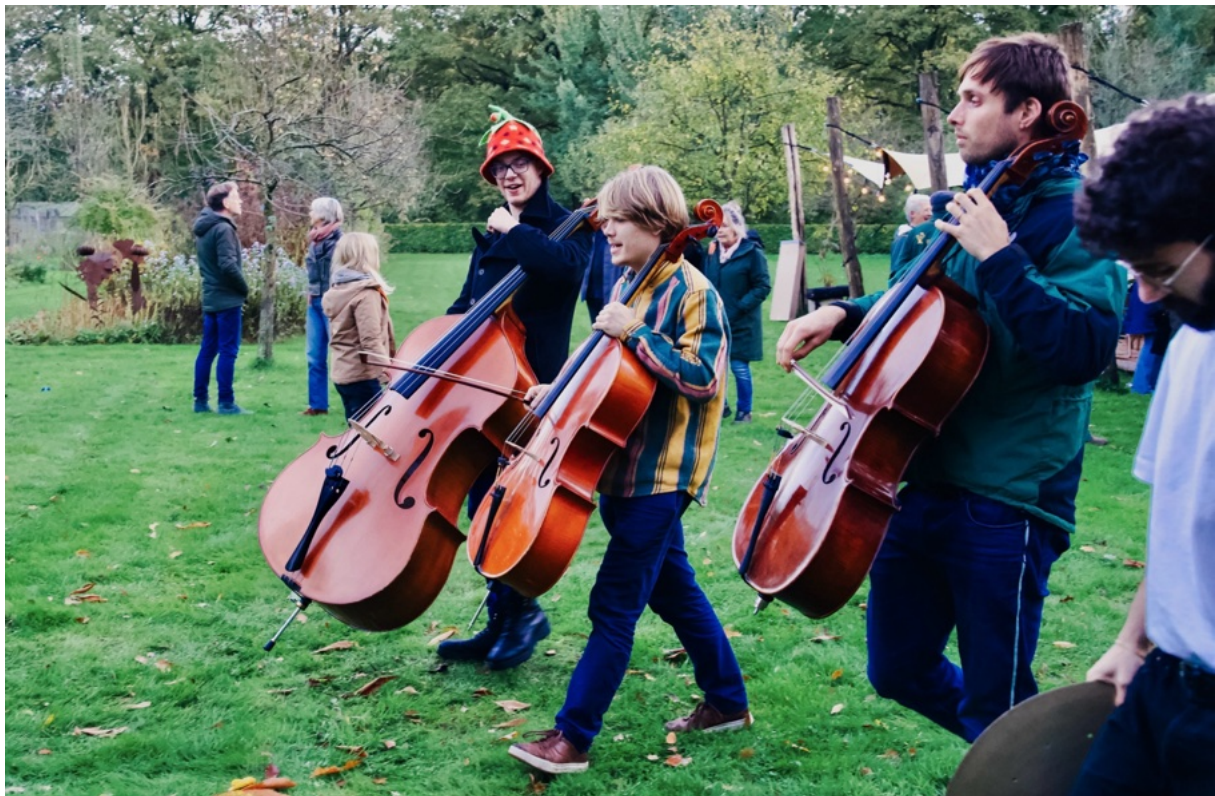
Er wordt al lopend gespeeld tussen de bomen op het landgoed Verwolde.

Naast de orkestleden zijn er ook de modulestudenten, de deelnemers aan de jeugorkestmodule en het publiek dat deelneemt aan de participatie & community activiteiten. Per 2021 voeren we jaarlijks de jeugdorkestmodule uit. In 2025 hebben we de frequentie echter aanzienlijk verhoogd naar drie edities, en die intensivering willen we de komende jaren vaker doorzetten. Met deze modules laten we jonge orkestleden niet alleen kennismaken met onze werkwijze, maar vormen ze ook een effectieve manier van ledenwerving. Dat de eerste deelnemer inmiddels auditie heeft gedaan, laat zien dat deze strategie begint te werken.