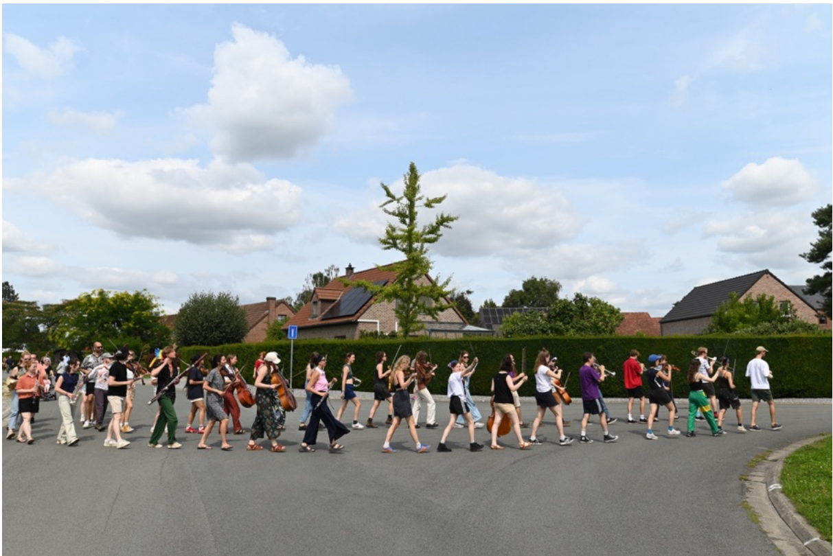
Loopstuk voor het optreden bij Mat'et Eau, in Namen