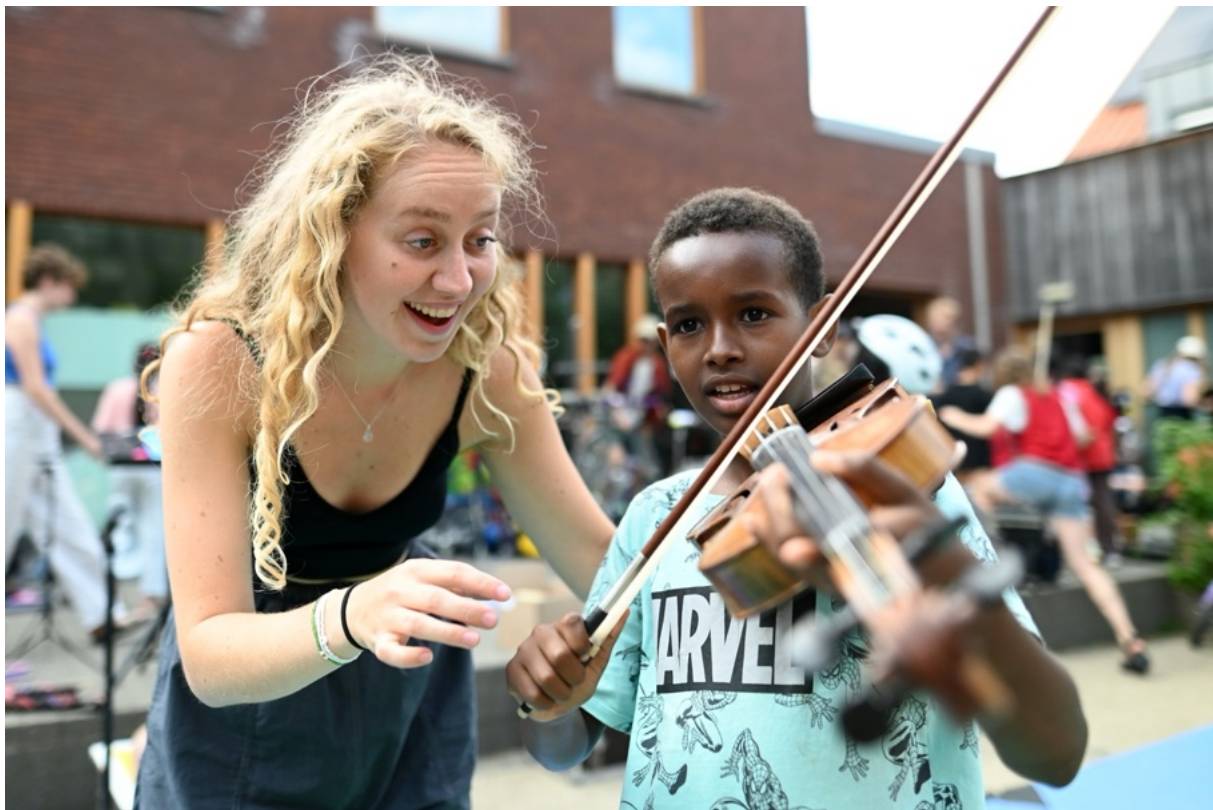
Muziekinstrumenten uitproberen, na afloop van het optreden bij de kinderopvang in Leuven

De sociale optredens komen tot stand in samenwerking met een maatschappelijke partner en zijn vaak besloten. Sommige van die partners bieden het Ricciotti jaarlijks een publiek, waarbij het kantoor kan rekenen op vaste afspraken omtrent uitkoopsom, sponsoring in natura en overige voorwaarden. In Amsterdam zijn dat bijvoorbeeld Kerk & Buurt (Nassaukerk) en Mentrum. Buiten Amsterdam zijn dat bijvoorbeeld de Amerpoort in Baarn, Resto van Harte in Utrecht en landelijke overheidsorganisaties zoals het COA en DJI. Iedere tournee initieert het Ricciotti nieuwe samenwerkingen met zorginstellingen en andere maatschappelijk betrokken partijen. In bijlage I is een lijst opgenomen met de maatschappelijke samenwerkingspartners in 2025.