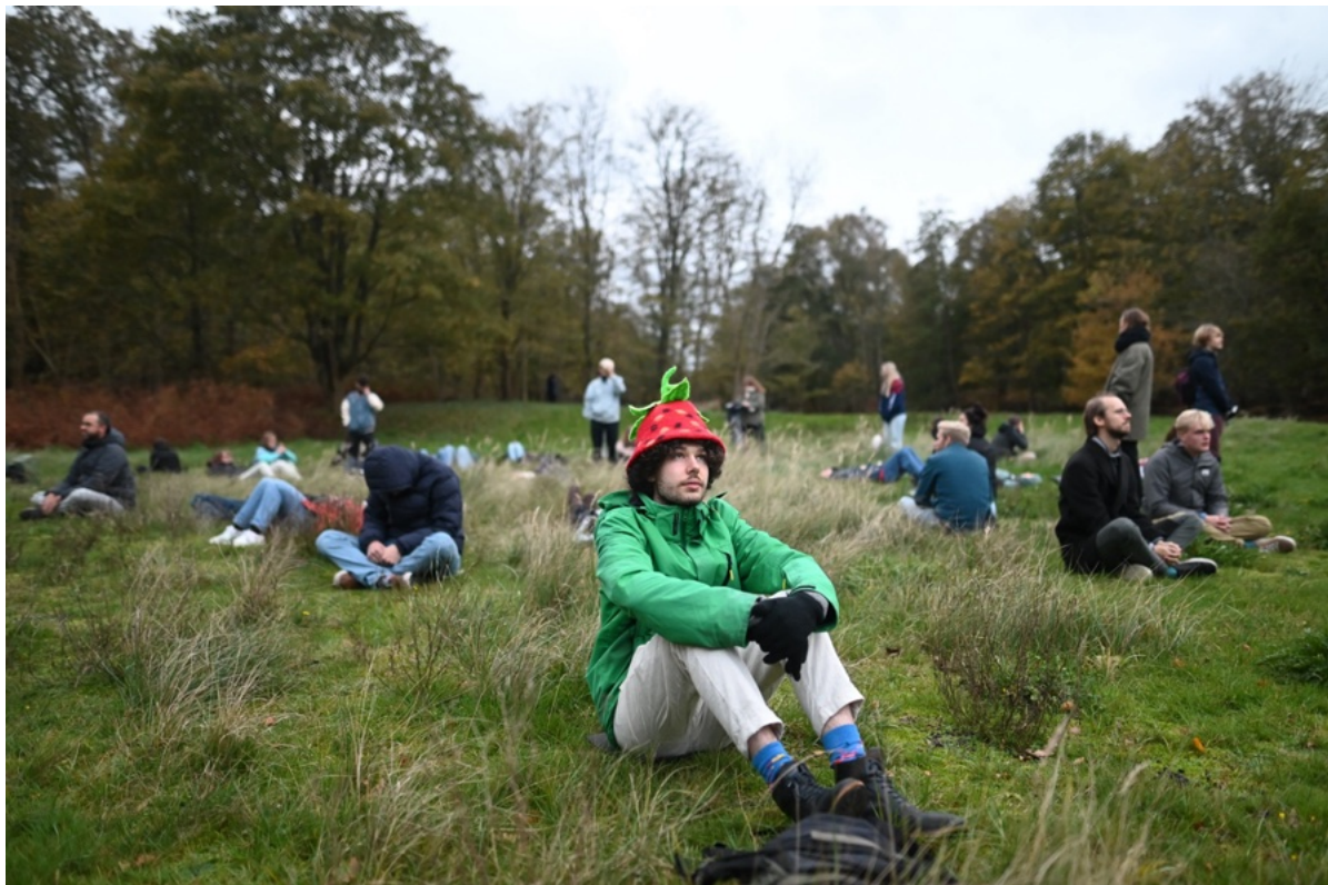
De orkestleden komen tot rust tijdens het bosbad in de Amsterdamse Waterleidingduinen

De publieke inkomsten zijn ten opzichte van 2024 ongeveer gelijk gebleven. Dit komt grotendeels door het herstelpakket van het FCP dat we in 2024 nog ontvangen hebben. echter, ook als we deze bijdrage buiten beschouwing laten, zijn deze inkomsten flink gestegen. Dit komt met name doordat de subsidie door het FPK in 2025 hoger was dan de subsidie door het FCP in 2024. Daarnaast is er voor de periode 2025-2028 ook een iets hoger bedrag aangevraagd bij het AFK, al ligt dit bedrag meer in lijn met de jaarlijkse indexaties. De overige publieke bijdragen vallen ook hoger uit dan begroot. Dit komt doordat we in 2025 wederom aanspraak konden maken op een bijdrage van Platform ACCT voor het in dienst nemen van een werknemer die voorheen als zzp'er voor onze organisatie werkten.