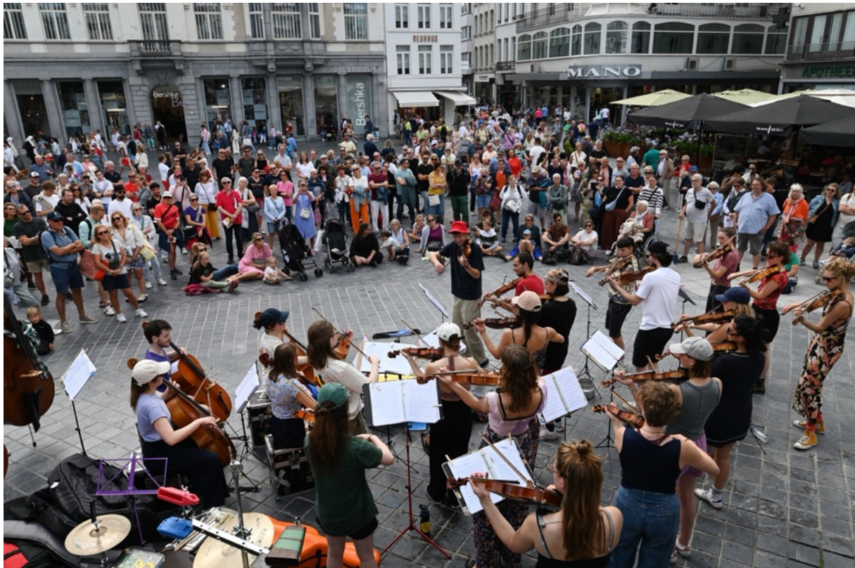
Kiosk op het Wapenplein in Oostende

De laatste tourdag brak aan en stond grotendeels in het teken van de terugreis naar Amsterdam. Eerst verzorgden we echter nog een last-minute optreden in een ziekenhuis in Luik, waar we speelden voor ernstig zieke kinderen. Daarna reisden we door naar Hoeve de Corisberg in Heerlen, waar mensen met een verstandelijke beperking verblijven. We werden daar hartelijk ontvangen met een fantastische lunch. De laatste bestemming was de Tolhuistuin in Amsterdam, waar maar liefst 330 mensen in het publiek aanwezig waren. De sfeer zat er direct goed in: het dak ging eraf en op een gegeven moment gingen zelfs de stoelen aan de kant en deed iedereen mee aan de dans van 't Smidje. Een feestelijkere afsluiting van de tournee had zich moeilijk laten voorstellen.