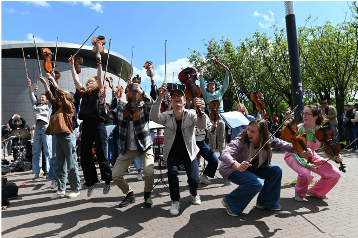
WildOp! op het Museumplein in Amsterdam

ten behoeve van de jaarverantwoording bij het Fonds Podiumkunsten in het kader van de regeling meerjarige productiesubsidies 2025-2028