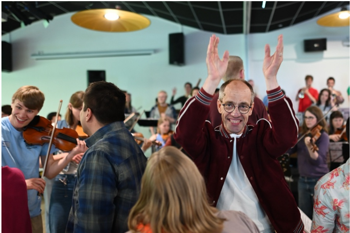
Optreden in de Amerpoort

Diezelfde avond speelden we ons vijfde optreden van de dag in het Kerkasiel Kampen. Op deze bijzondere plek wordt asiel geboden aan een Oekraïens gezin door de kerkdienst onafgebroken gaande te houden. Tijdens het diner voorafgaand aan het optreden vertelde een van de organisatoren over de situatie en het ontstaan van deze vorm van opvang, wat vrijwel het hele orkest zichtbaar raakte. Het optreden werd vervolgens geopend met het overhandigen van een kaars, als symbool voor het overnemen en voortzetten van de dienst. Voor veel leden groeide dit uit tot een van de meest bijzondere en betekenisvolle optredens tot nu toe. Na afloop werd de dienst weer overgedragen aan de volgende groep.