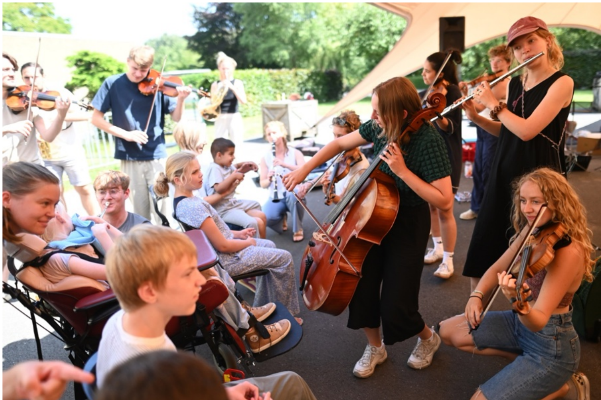
Hoofdsite Leieborg, een woonvoorziening voor mensen met een handicap in Deinze

Bijzonder aan Ricciotti's Klankbos was de aftrap met een televisieoptreden bij Podium Klassiek op 19 oktober. Het was zes jaar geleden dat het orkest daar voor het laatst te gast was. Het succes leidde tot een tweede uitzending op 28 december, tijdens de aflevering met de hoogtepunten van het afgelopen jaar. Naar deze uitzendingen keken respectievelijk 209.000 en 276.000 kijkers. De grote zichtbaarheid vertaalde zich in een hoge publieksopkomst tijdens de tournee en in de aanwas van nieuwe donateurs. We hebben ervaren wat het belang van landelijke zichtbaarheid is, waar we doorgaans besloten optredens geven en vaak op minder zichtbare locaties komen. Met deze les zullen we ook de komende jaren inzetten op deze landelijke zichtbaarheid, eventueel door hier externen voor in te huren.