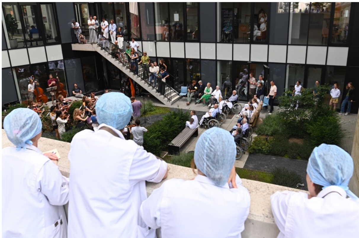
Heilig Hart Ziekenhuis Leuven

Het Ricciotti heeft een dubbele missie: enerzijds het brengen van live symfonische muziek, overal en voor iedereen, en anderzijds de ontwikkeling van jong muzikaal talent. Door jonge musici te leren door middel van muziek wezenlijk contact te maken met hun publiek, leveren wij een bijdrage aan de leefbaarheid van de samenleving. Wij zoeken het publiek actief op, op de plekken waar het werkt, woont of recreëert.